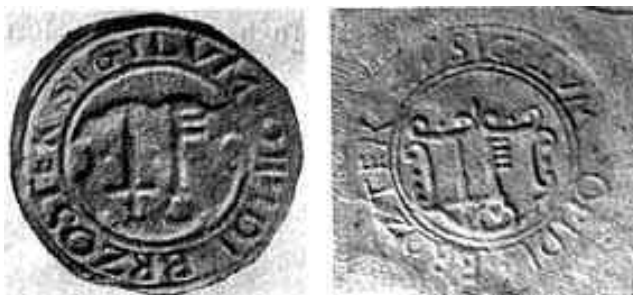
Odciski pieczęci rady miejskiej Brzostku z XVI i XVIII w.

Choć dokument bezpośrednio o tym nie wspominał – zgodnie z ówczesną praktyką osadnikom przydzielano gospodarstwa o znacznie mniejszym obszarze niż te nadane wójtowi. Były to pół-