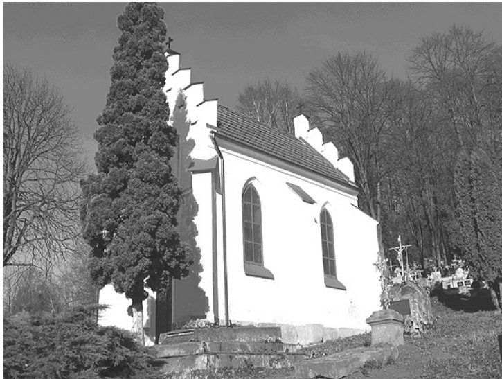
Kaplica poświęcona ofiarom 1846 r. w Siedliskach.