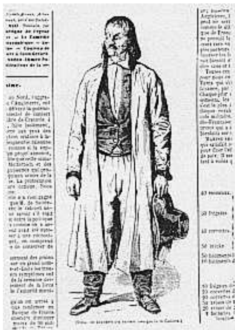
Podobizna J. Szeli w Illustration Journal Universal (nr 197 z grudnia 1846 r.)

Natura obdarzyła go okazałą postawą, dużą siłą fizyczną, stanowczym charakterem i chłopską mądrością. Tymi cechami zwracał na siebie uwagę nie tylko chłopów, ale i dworu. W swoim postępowaniu był zdecydowany, chociaż czasami nieobliczalny.